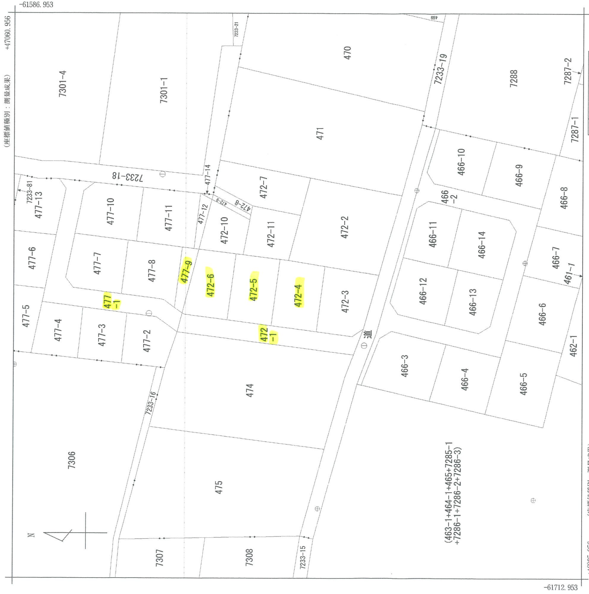
(座標値種別：測量成果)